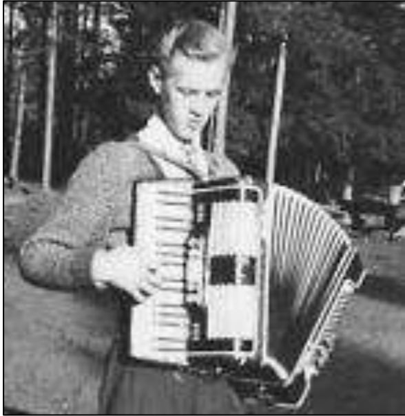
Oma harmonikka kesällä 1956 ja isän haitari vuonna 2021.