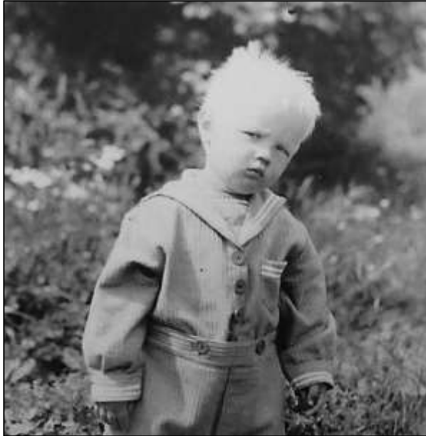
Merimiehen asussa kesällä 1940.

Olihan se tunteita myllertävää 77-vuotiaana vastaanottaa viimeinkin virallinen tunnustus sotaorpuudesta. Saman kunnianosoituksen on saanut 16 000 talvi- ja jatkosodan orpoa. Isäni kaatuessa talvisodassa 15.2.1940 olin 2½-vuotias.