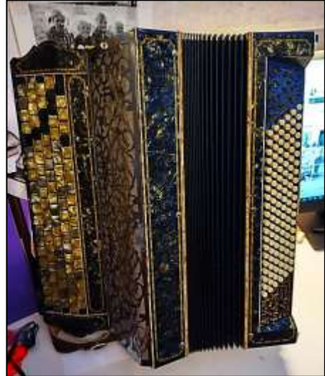
Isäni ja hänen haitarinsa Kouvolan kravatti 1930-luvulta