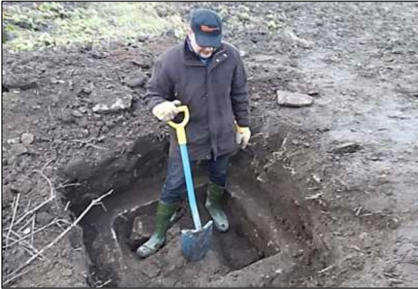
Kaivo on löytynyt.

Vuoden 1992 sopimuksen ansiosta Venäjältä on löytynyt tähän mennessä jo yli 1 500 suomalaista sankarivainajaa, joista 416 on pystytty tunnistamaan varmuudella Suomessa tehtyjen dna-testien ansiosta. 2018 jälkeen yli 400 sotavainajaa on dna-testien kautta tunnistettu ja siunattu seurakuntien hautausmaihin. Nimet ja joitakin tarinoita on julkaistu nyt Ilta-Sanomien erikoislehdessä. 3